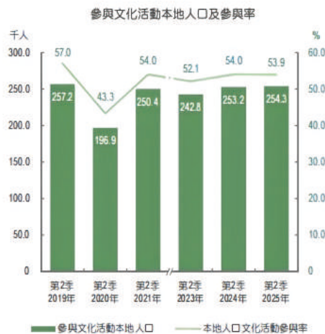
圖 3 參與文化活動本地人口及參與率

總體而言，澳門的文旅融合路徑應從以往的“單向旅遊驅動”轉型為“居民+遊客”雙向並重的模式。透過沉浸式城市劇院的建設，既能滿足居民日益增長的多元文化需求，又能推動文旅產業的高品質發展，從而在文化維度上落實“人民城市”的發展理念。