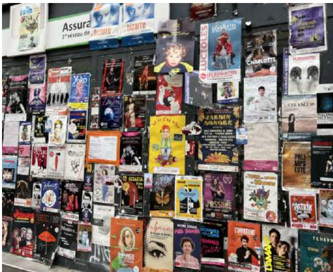
圖1 阿維尼翁海報牆

阿維尼翁戲劇節對城市的影響具有全方位性。這一轉型為阿維尼翁帶來了新的文化定位。它原本只是法國南部的一座小城，但依靠戲劇節的舉辦，成為具有全球影響力的地標，以“世界三大戲劇節”之一的身份在國際文化界佔有一席之地。這種城市形象的改變，讓阿維尼翁在全球文化版圖中佔據了重要位置。